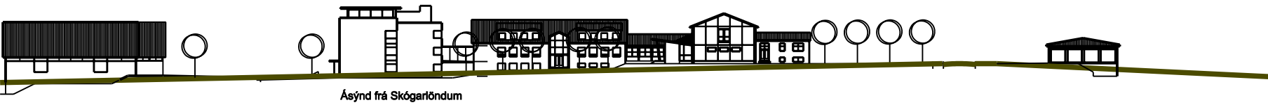
Ásýnd frá Skógarlöndum