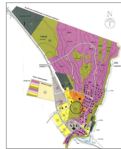
ADALSKIPULAG FELLAHREPPS 2000-2012

Gert er ráð fyrir að vallarhús fyrir gervigrasvöll verði staðsett innan byggingarreits vestan vallarins. Innan byggingarreitsins er heimilt að reisa byggingu á tveimur hæðum. Byggingarreiturinn er 320 m 2 en flatarmál gólfplatar byggingar skal að hámarki vera 200 m 2 . Staðsetning innan byggingarreits er frjáls. Byggingin skal felld inn í brekkuna þannig að gengið verði inn á 1. hæð frá bílastæði en inn á 2. hæð frá knattspymuvelli. Sjá jafnframt skýringarmynd á deiliskipulagsupprætti, snið A-A.